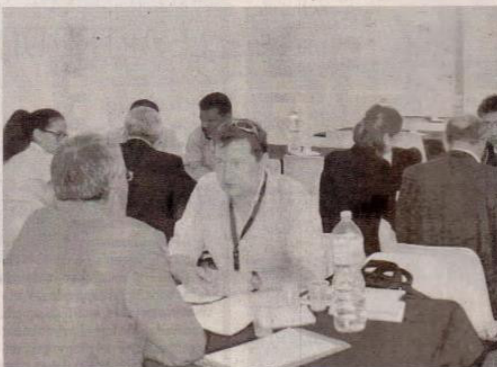
Incontri fra imprenditori nella passata stagione

●●● Oggi si apre a Mazara la quarta edizione del Blue Sea Land, luogo ove i sapori incontrano l'arte, la cultura e l'economia. Alle 17 saranno di scena la fanfara dei bersaglieri e balli folk per le strade della città in festa. E' anche l'inizio della rassegna "Blue Show/Events", sempre nella suggestiva cornice dei vicoli del centro storico mazarrese, ove si incroceranno sapori, suoni, colori, attraverso laboratori del gusto, manifestazioni enogastronomiche ed artistico-culturali, attraverso le quali si narreranno storie di uomini di terra e di mare. Ma, principalmente, Blue Sea Land fornisce concrete possibilità di interazioni economiche attraverso "Blue Business": un fitto calendario di incontri "b2b" che si terranno nella tre giorni (oggi, sabato e domenica) grazie alla presenza di buyers nazionali ed internazionali che incontreranno produttori della filiera agro ittica-alimentare. E' anche un expo siciliano particolare perché crocevia di dialogo interculturale ed interreligioso che culminerà anche quest'anno, in programma domenica alle ore 16, nel cuore della stessa casbah ove convivono da anni autoctoni ed immigrati, con l'incontro fra rappresentanti di diverse religioni che reciteranno l'invocazione rotariana per la pace fra i Popoli. 220 stand predi-